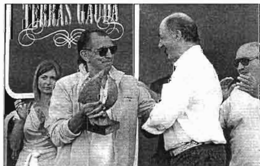
Entrega del mejor barco de ORC 570 al Pairo 8.