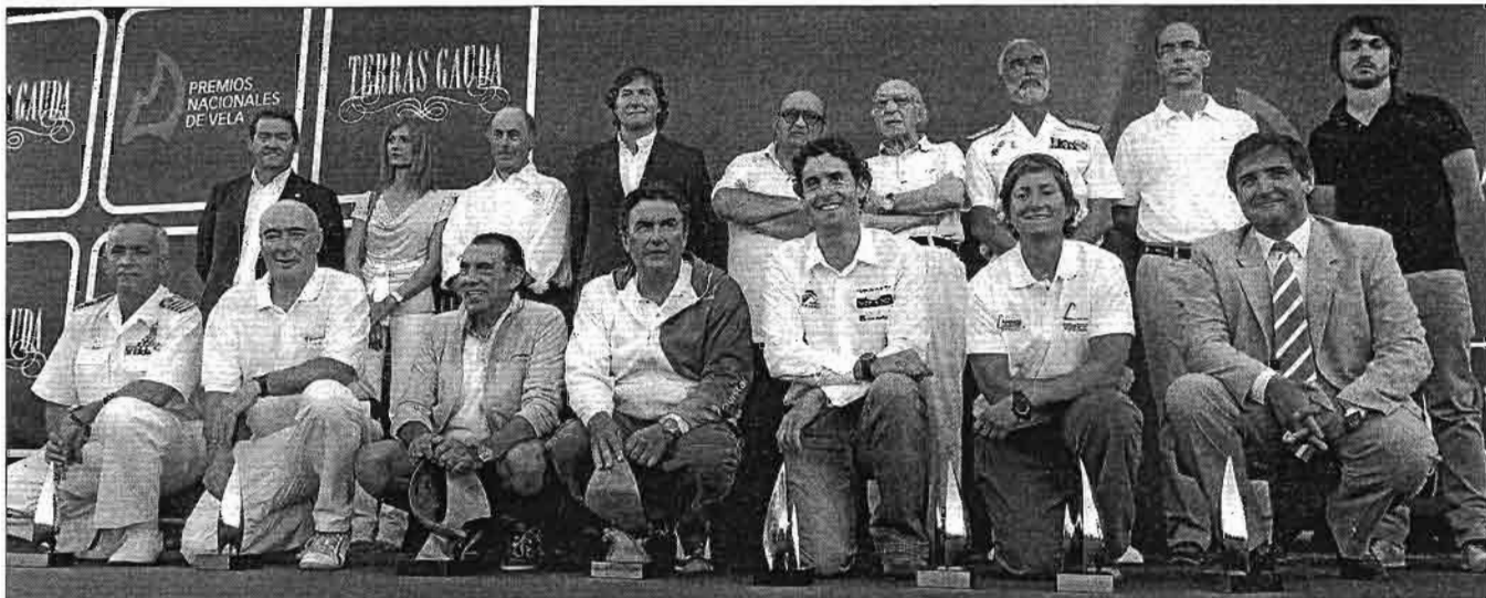
Foto de familia con los premiados y las autoridades que asistieron a la entrega de los Premios Nacionales de Vela.

VELA ▶ Trofeo Príncipe de Asturias-Gran Premio Caixa Galicia